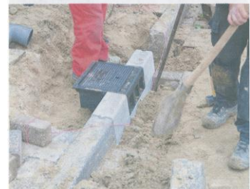
De bandkolk van Nering Bögel.

Geen nominaties zijn aangewezen in de categorie Outside-the-box innovatie voor innovaties 'buiten de gebaande paden'. Uit een vierde categorie komt een prijs voor een inzending die routinematig werk versnelt, oftewel: kan hetzelfde worden geleverd in de helft van de tijd. Genomineerd zijn Arcadis, Cup Engineering, Dura Vermeer, Haasnoot Bruggen, Heijmans en Poly Products.