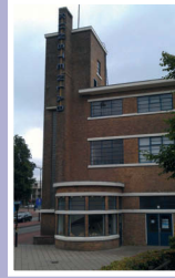
1. Modellenmakerij en gedenkzegel, Emmastraat.