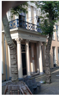
6. De Hereening.