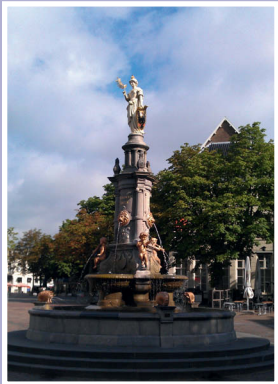
5. Wilhelminafontein, Brink.