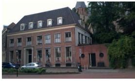
2. Bergschild met woonhuis.