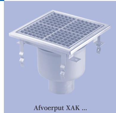
Afvoerput XAK ...